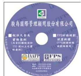
(內含 84 種稅法輯要 & 150 個稅法案例)

* 相關課程內容，可於駿為國際網站 ( www.jeffwell.com ) 查詢。